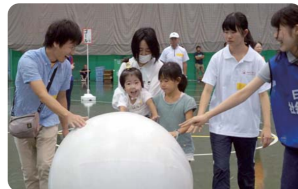
子どもも大人も障害があってもなくてもみんなで楽しく運動会！

「居場所づくり」「災害対策」「障害への理解」など多様化する生活課題に対し、地域の交流を育み、住民が相互に協力・連携し合えるようにつながりがうまれる地域づくりを進めています。