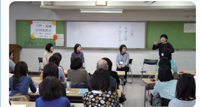
手話の技術とともに「聴覚障害」についての理解を深めます！(手話講習会)

多様な福祉教育を通じて、地域福祉活動に関わる担い手を育成しています。また、福祉の仕事に関する就労支援や福祉事業所従事者向けの研修会など、不足する福祉人材の育成・確保に努めています。