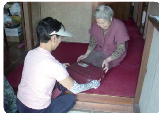
1人暮らしの高齢者へお弁当のお届けとともに見守りをしています(配食サービス)

高齢者や障害のある方が、住み慣れた地域で暮らしていくための支援を行っています。様々な支援活動において、支援の担い手として、住民の理解と協力をいただいています。